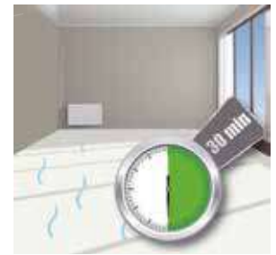
Beschichtung restfeuchter Linoleumbeläge

Für alle wasserbeständigen Belagsarten außer Holzböden, Laminat, textile Beläge und Böden, für die eine Beschichtung nicht empfohlen wird. Bestens geeignet für Krankenhäuser, Altenpflegeeinrichtungen und andere medizinische Einrichtungen, wo der Einsatz von Händedesinfektionsmitteln erforderlich ist.