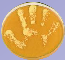
Handabklatsch ohne Seifenwaschung oder Desinfektion

Mit ihrer „Clean Care is Safer Care“-Initiative startete die WHO 2005 eine weltweite Kampagne für mehr Patientensicherheit. Im Mittelpunkt steht die Verbesserung der Händedesinfektion, da diese einen direkten Einfluss auf die Übertragung pathogener Erreger hat. Für dieses Ziel wurde das Konzept der „5 Momente der Händedesinfektion“ entwickelt (1).