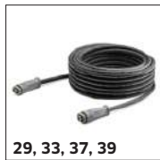
29, 33, 37, 39