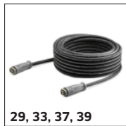
29, 33, 37, 39