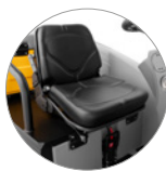
Einstellbarer ergonomischer Sitz