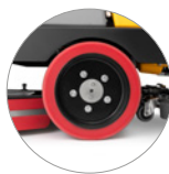
Antrieb an den Hinterrädern (Optional)