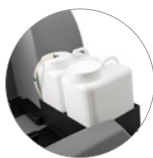
Chemical mixing system