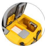
Sammelfilter für große Unreinheiten + Schutzfilter des Saugmotors