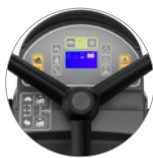
Praktische und intuitive Bedienpult mit Display