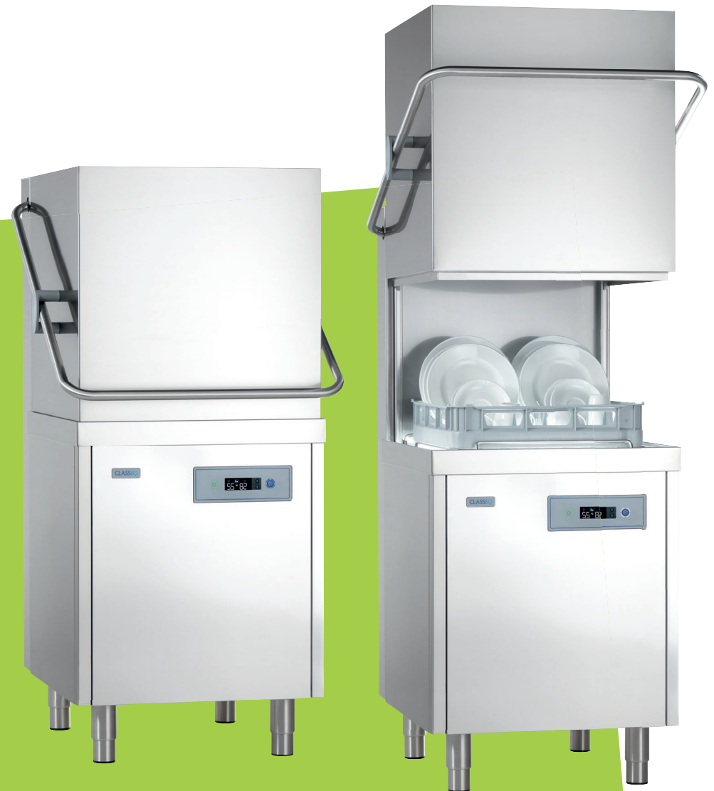
P500 RBP mit Drucksteigerungspumpe Bestellnummer 901V0055