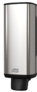
Tork Spender Schaumseife Stahl S4 460010