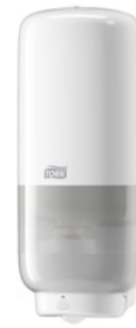
Tork Soap-Sanit Disp – Int Sens, wh 561600