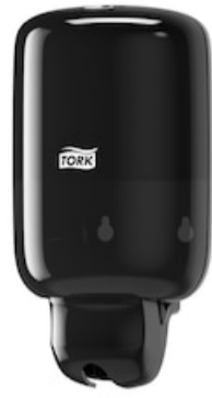
Tork Mini Spender Flüssigs Elev schw S2 561008