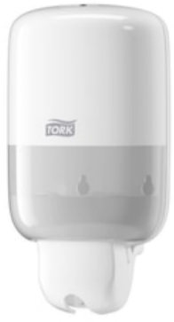
Tork Mini Spender für Flüssigseife weiß 561000