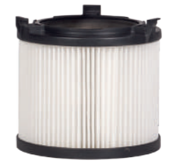
HEPA 13 Feinstaub-Filterpatrone. Art.-Nr. 116106