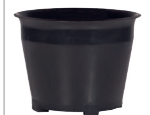
Zykloneinsatz. Art.-Nr. 116105

Durch den Drall am Einlassstutzen wird der Sprühnebel an der Behälterwand abgeschieden. Zusätzliche Filterstoffe sind nicht mehr notwendig. Die zuverlässige Schwimmerabschaltung reagiert selbst bei extremer Schaumbildung. Seitliche Kühl-Luftschlitze sorgen für konsequente Trennung von Kühl- und Prozessluft.