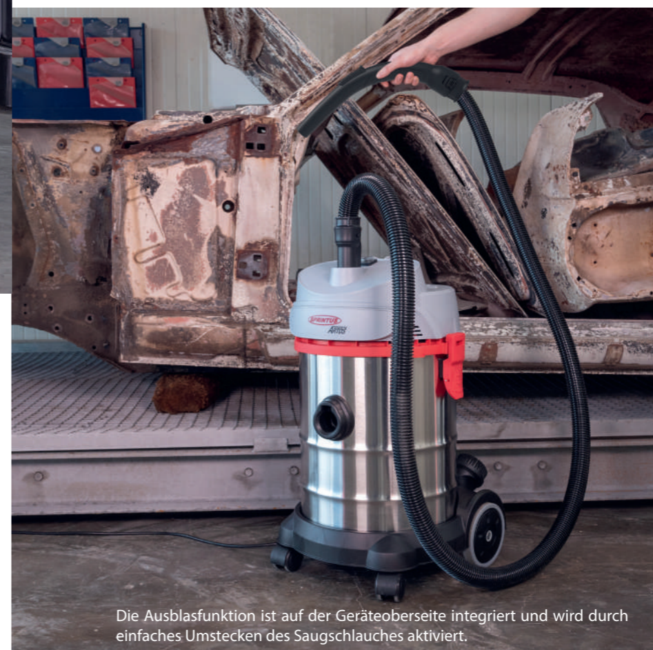
Die Ausblasfunktion ist auf der Geräteoberseite integriert und wird durch einfaches Umstecken des Saugschlauches aktiviert.