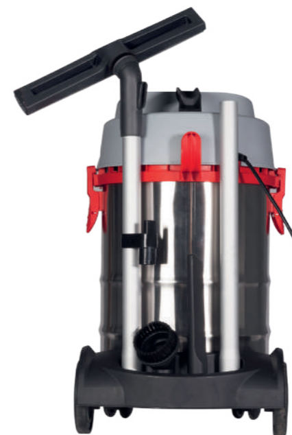
Robustes Fahrwerk mit 4 Zubehörsteckplätzen auf der Geräterückseite.