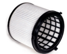
HEPA 13 Feinstaub-Filterpatrone zum Trockensaugen.