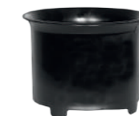
Zykloneinsatz zum Nasssaugen.

Durch den Drall am Einlassstutzen wird der Sprühnebel an der Behälterwand abgeschleudert. Zusätzliche Filterstoffe sind nicht mehr notwendig. Die zuverlässige Schwimmerabschaltung reagiert selbst bei extremer Schaumbildung. Seitliche Kühl-Luftschlitze sorgen für konsequente Trennung von Kühl- und Prozessluft.